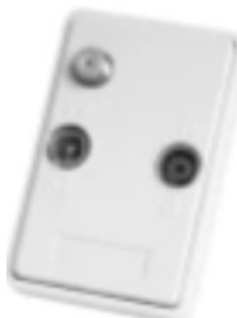
Eksisterende tilslutnings Emne kan genanvendes